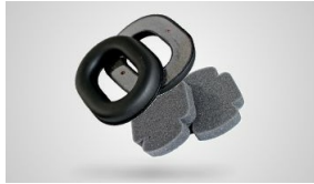
KIT REPUESTO L-340 CASCO Recambio modelo Casco L-340