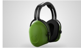
L-360 - HI-VISIBILITY Protector auditivo externo Modelo Vincha – NRR 29 dB- SNR 32 dB