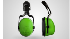
L-360 HI-VISIBILITY P/ CASCO Protector auditivo Externo Modelo Casco – NRR 26 dB- SNR 32 dB